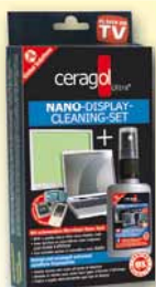
Display Cleaning Set Bildschirm-Reiniger 11,99€