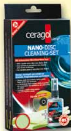
Disc Set CD/DVD-Versiegler 19,90€