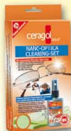
Optica Set Brillenreiniger 8,99€