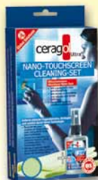
Touchscreen Set Anti-Fingerprint 12,99€