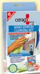
Simplex Set Bügeleisenreiniger 9,90€