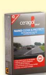
Clean&Protect Set Autoscheiben-Versiegler 14,99€